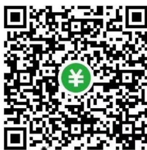
广州市汽车服务业协会